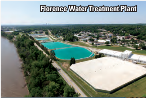
Florence Water Treatment Plant