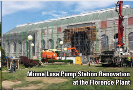
Minne Lusa Pump Station Renovation at the Florence Plant