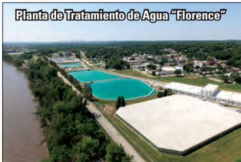
Planta de Tratamiento de Agua "Florence"