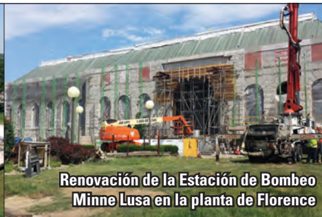
Renovación de la Estación de Bombeo Minne Lusa en la planta de Florence