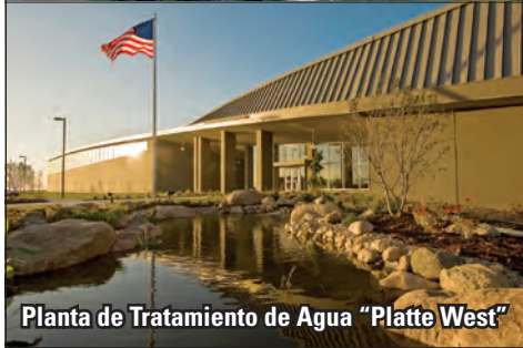
Planta de Tratamiento de Agua "Platte West"