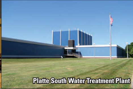
Platte South Water Treatment Plant

To ensure that tap water is safe to drink, the Environmental Protection Agency (EPA) prescribes regulations to limit the amount of certain contaminants in water provided by public water systems.