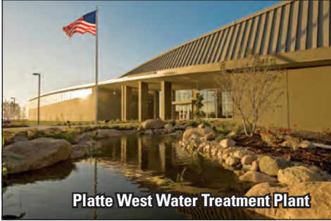
Platte West Water Treatment Plant