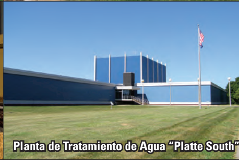
Planta de Tratamiento de Agua "Platte South"

con 72 horas de antelación si necesita algún tipo de alojamiento especial, formatos alternativos o lenguaje por señas al 402.504.7141 o TTY 402.504.7024. Comenzamos a transmitir en nuestro sitio web las reuniones de la cámara directiva en el 2016.